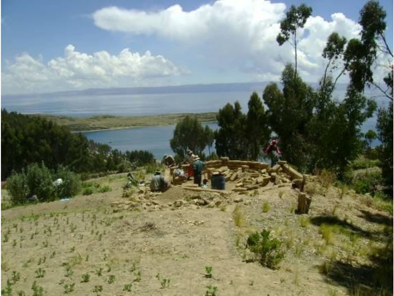
Inicio de las construcciones de la Escuela / Retiro, 2011