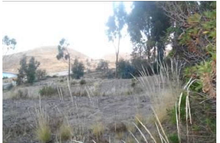
Wiñay Qhana Wawa