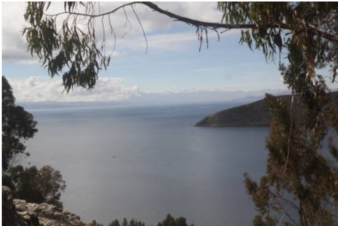
Vista al majestuoso Nevado Illampu