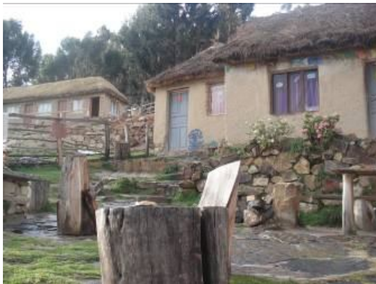
Dormitorios en el Refugio Wiracocha, a 30 minutos a pie de la Escuela / Retiro